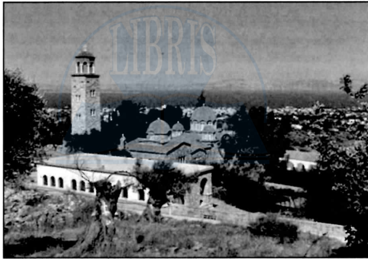
Mănăstirea Sfântului Efrem cel Nou de la Nea Makri

Sfântul Efrem lipsea în vremea aceea, căci se afla în ascunzișul său pustnicesc de pe munte și, când s-a întors, i-a fost dat să vadă priveriștea înspăimântătoare a trupurilor fraților săi monahi, care fuseseră uciși sălbăticește și aruncați prin toată mănăstirea.